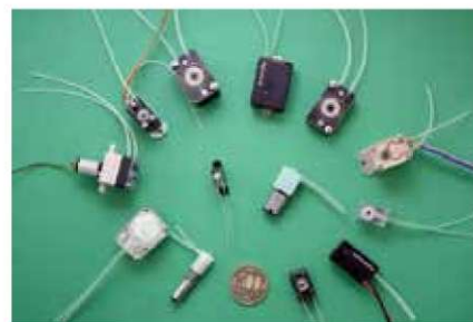
独自技術の超小型のマイクロポンプ

チューブポンプの構造をシンプルにして製造過程を工夫することで、従来品の弱点である寿命を克服し約4倍にしたことに加え、世界最小レベルの超小型化を実現し、日本と米国で特許を取得した。超小型のマイクロポンプは、iPS細胞等の国内外の細胞培養や再生医療分野の研究現場で広く使われるだけでなく、NASAの宇宙実験用のデバイスやJAXAにも採用されている。また、医療用機器や大手の最高機種プリンター等にも採用されており、今後も幅広い分野での需要が期待される。