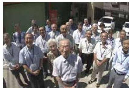
楽しみながら生き生きと働く社員達

能力、気力、体力をもつシニアの多くがキャリアを活かした職につけない現状を問題視し、創業時から多く雇用する経験豊富なシニアが、3/4を占める。シニア社員は方針さえ示せば、自ら考え期待以上の成果をあげるため、本人の要望や適性を見極めて適材適所を實踐して自主性を尊重したゆるい管理やコミュニケーションを大切にしている。それが自由で発想力豊かな製品開発に、ひいては売上拡大に繋がることで、社員は意欲が高まり、楽しみながら仕事をしている。また、未経験分野でも挑戦できる社内風土や最先端技術の社内勉強会の活発な開催等、さらに向上できる環境が整っている。