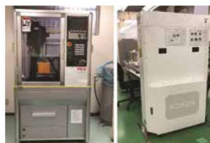
高付加価値商品製造用の新規導入機器

チューブポンプの需要拡大に伴い、付加価値の高い事業や新規事業の技術開発に、より計画性を持って専念集中できる環境を作るため、ロットの大きな製品組立は外部に委託する方法に変更した。一方、今後、生産の急速な伸びが予測されるマイクロポンプについては、精密性が命であるため内製化を進める方針であり、それに伴い精密加工機、溶着器、クリーンベンチ等の設備を2019年末までに導入し、付加価値向上に繋げている。