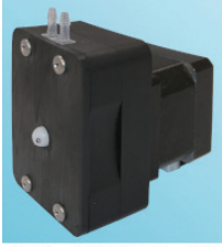
ポンプヘッドを取り付けた状態