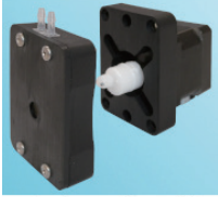
ポンプヘッドを外した状態