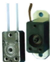
取外し可能なポンプヘッド