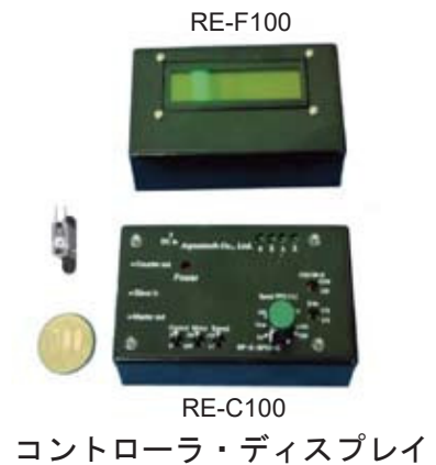
コントローラ・ディスプレイ